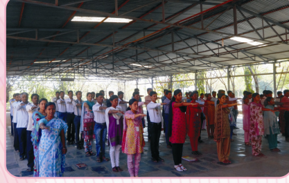
'स्वच्छ भारत' ची शपथ घेताना महाविद्यालयीन विद्यार्थी व कर्मचारी