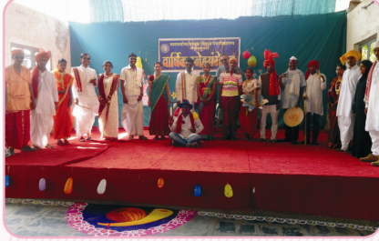
वार्षिक स्नेहसंमेलनात चेपभूषा स्पर्थेत सहभागी विद्यार्थी