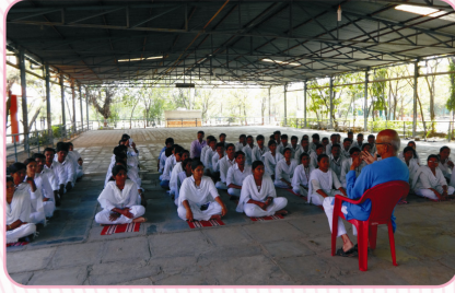
'खादीचे महत्व' यावर मार्गदर्शन करतांना आदरणीय बाबुजी