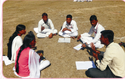
गटचर्चा करतांना महाविद्यालयाचे विद्यार्थी.