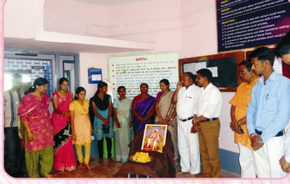
छत्रपती शिवाजी महाराज यांची जयंती साजरी करतांना महाविद्यालयातील कर्मचारी.