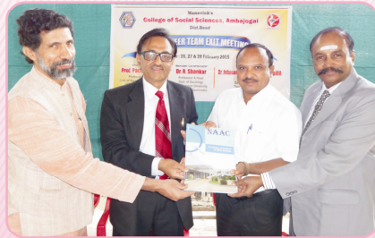
नॅक चा अहवाल प्राचार्यांना हस्तांतरीत करताना नॅक पेअर टीमचे सदस्य